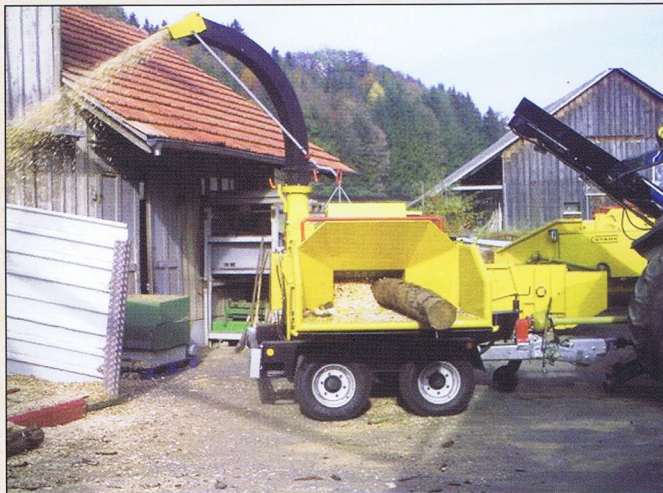
SH 35/70 Zapfwellenmaschine mit Auswurfgebläse