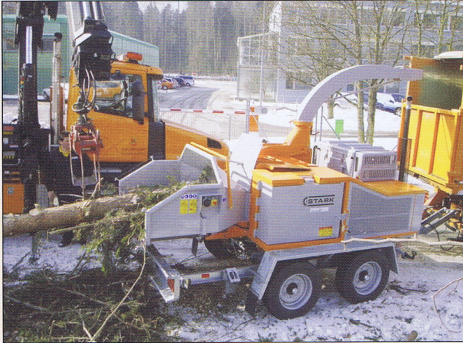
SH 35/70 Motormaschine mit Wurfgebläse